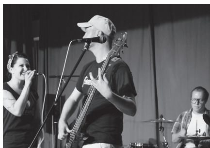
Alice Wants Revenge

Durch das Jugendforum gesponsert werden diese Bands zusätzlich mit einem Aufnahmegerät in ihrem weiteren Werden unterstützt. Auch die sechs nicht auserchorenen Bands gingen nicht leer aus. Neben guter Laune und Bühnenerfahrung für alle erhielten diese einen Gutschein für Musikerbedarf in Höhe von 50 €.