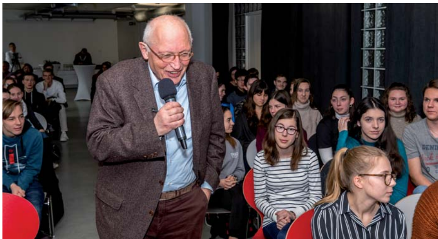
Günter Verheugen in der Diskussion mit Schülern des Sonneberger Hermann-Pistor-Gymnasiums und des Neustadter Arnold-Gymnasiums