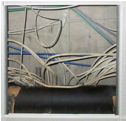
Alte elektrische Leitungen im Deckenbereich

Um den Erfordernissen der heutigen Technologien gerecht zu werden, muss moderne Technik und dadurch entsprechende Kabelstränge verbaut werden.