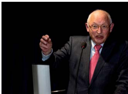
Günter Verheugen referiert über den politischen Wandel, der letztlich auch zum Fall der Mauer und zur Osterweiterung der EU beigetragen hat

jährliche Quoten durchaus für ein geeignetes Mittel. In der AfD sehe er eine große Gefahr und unterstrich, dass er es für sehr kurzichtig halte, die AfD nur als Partei von Protestwählern zu sehen. Die führenden Kräfte dieser Partei wüssten ganz genau, was sie wollten und sprächen daher gezielt nationalistisch und rassistisch eingestellte Zielgruppen an.