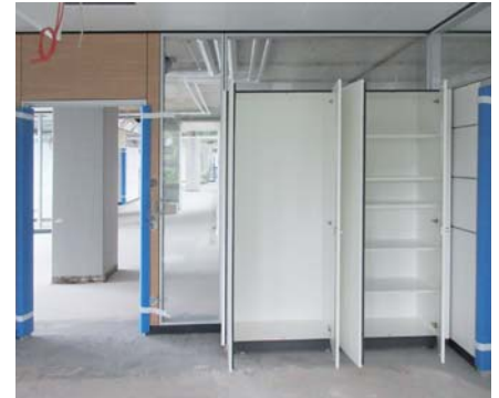
Einbau der Systemtrennwände und Schränke

Im 2. Obergeschoss sind diese Arbeiten bereits abgeschlossen.