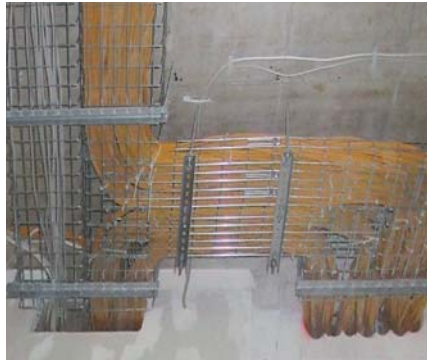
Neue Verkabelung im Deckenbereich

Auf dem folgenden Bild sind sogenannte „Datenautobahnen“ klar erkennbar.