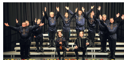
URAL KOSAKEN CHOR

„Schneeverwehtes Russland“ - 90 Jahre nach der Gründung durch Andrej Scholuch präsentiert der Ural Kosaken Chor auf seiner Jubiläumstournee Lieder aus dem alten Russland und der Ukraine. Die Auftritte der Ural Kosaken sind auch bei vielen örtlichen Chören zum festen Bestandteil geworden: alle 2 Jahre Wiederholungskonzerte – natürlich mit immer neuem Programm – sind keine Seltenheit. Die Popularität des Ensembles mit seinen außergewöhnlichen Stimmen ist ungebrochen.