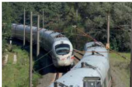
Von und nach Nürnberg; Begegnung zweier ICE T Baureihe 411 bei Zapfendorf (Strecke Bamberg - Lichtenfels), Foto: Claus Weber, Deutsche Bahn AG

Fernverkehr wird über Erfurt und Würzburg umgeleitet • drei Buslinien im Regionalverkehr je Richtung zwischen Bamberg und Lichtenfels • Halbstunden-Takt zwischen Nürnberg und Bamberg