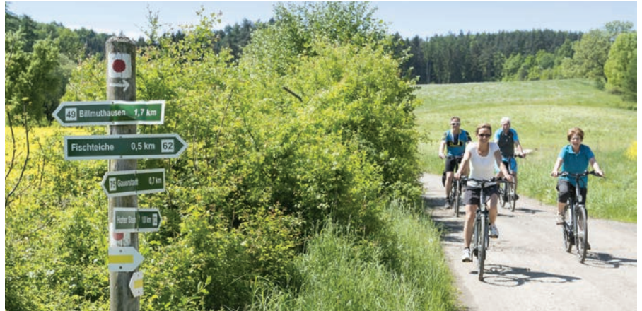
Radfahrer in der Urlaubsregion Coburg.Rennsteig finden an vielen Stationen in der Region den passenden Service.

oder per Mail an info@coburg-rennsteig.de angefordert werden und stehen unter www.coburg-rennsteig.de zum Download zur Verfügung.