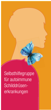
Selbsthilfegruppe für autoimmune Schilddrüsenerkrankungen

Seit diesem Monat wollen wir mit unserer Selbsthilfegruppe Schilddrüse auch Menschen mit Schilddrüsenkrebs ansprechen. Wir möchten Ihnen zuhören und mit Ihnen reden, helfen aus der Verzweiflung herauszufinden und wieder Mut zu fas-