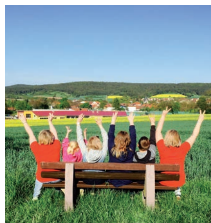
In den Lacrima-Gruppenstunden gewinnen die Kinder gemeinsam neuen Lebensmut.