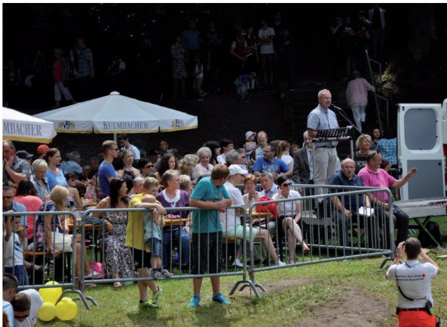
Neustadter Kinderfestumzug 2018

Auskunft bezüglich der Termine: Stadtverwaltung Neustadt, Bereich Kultur, Sport, Tourismus, Telefon 09568 81-132 oder unter www.neustadt-bei-coburg.de