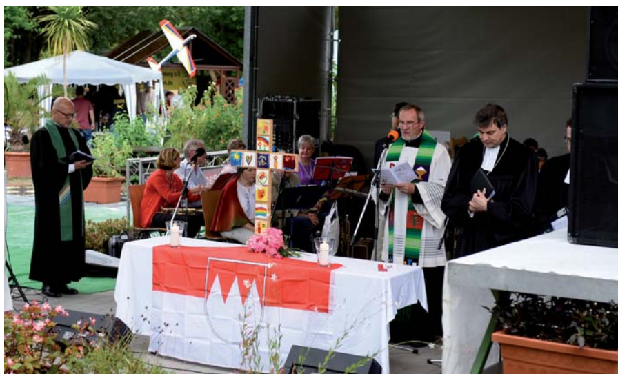
Eröffnet wurde der „Tag der Franken“ mit einem ökumenischen Gottesdienst, zum Teil in fränkischer Mundart, im Freizeitpark Neustadt.

„Die Premiere, dass Neustadt b.Coburg und Sonneberg den „Tag der Franken“ gemeinsam und noch dazu länderübergreifend ausgetragen haben, war ganz sicher ein Erfolg. Dank des außergewöhnlichen Engagements unzähliger Akteure konnten wir ein wundervolles fränkisches Bürgerfest mit tausenden Gästen aus nah und fern feiern.“