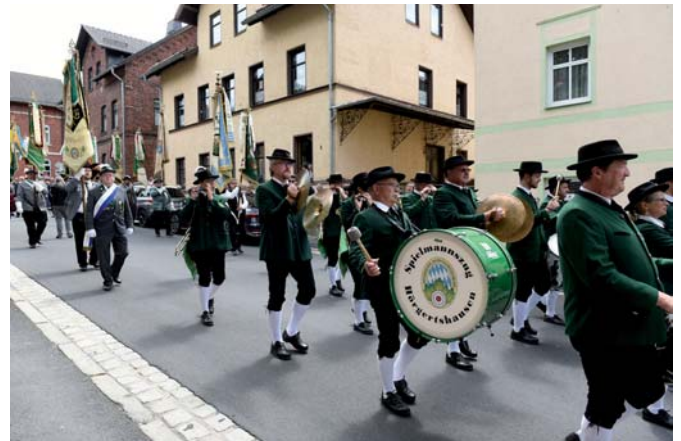
Die Schützengesellschaft Schießhaus Sonneberg von 1851 hatte im Rahmen des 175. Sonneberger Vogelschießens Schützenbrüder aus Bayern und Thüringen zum großen Schützenumzug eingeladen.