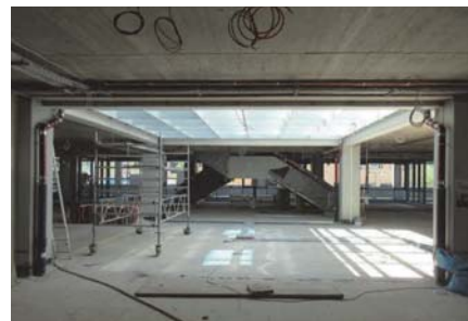
Innenhof mit Stahlträgerkonstruktion