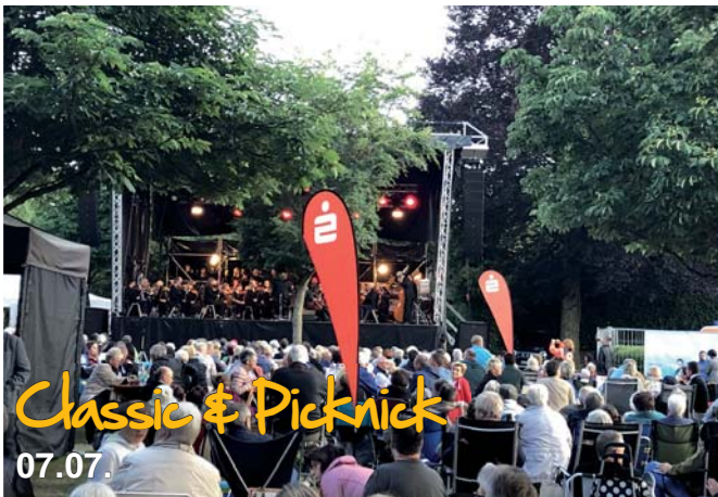
Classic & Picknick 07.07.