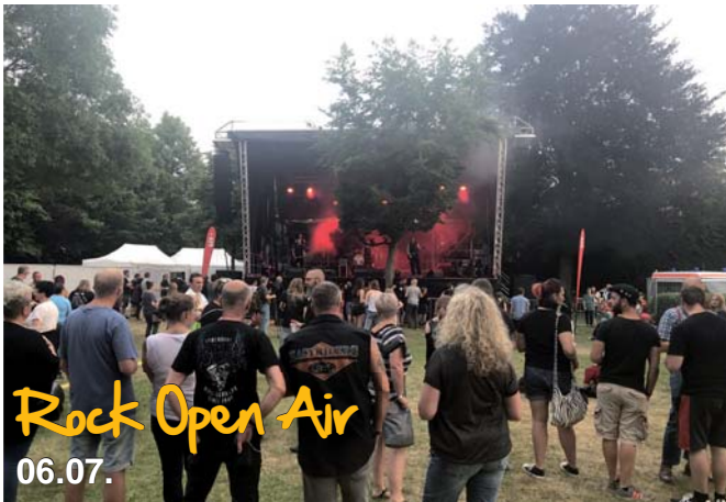
Rock Open Air 06.07.