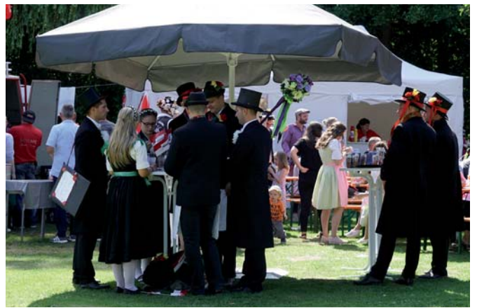
In Neustadt fand die zentrale Kultur- und Festmeile im Freizeitpark Villeneuve-sur-Lot statt.