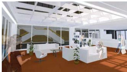
Visualisierung des zukünftigen Lese- und Multifunktionsbereichs; Entwurf des Architekten

Im Erdgeschoss wird der große freiliegende Innenhof im Zuge der notwendigen, umfangreichen Rathaus-Sanierung die größte sichtbare Veränderung erfahren.