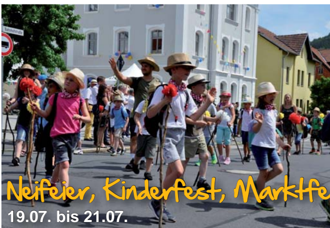
Neifeier, Kinderfest, Marktfest 19.07. bis 21.07.