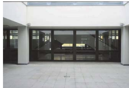
Innenhof vor der Sanierung

Nach der Fertigstellung der Rathaus-Sanierung werden Besucher der vergrößerten Mediathek alle Neuerungen in einer angenehmen Atmosphäre mit zusätzlicher natürlicher Belichtung nutzen können.