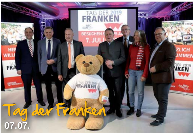
Tag der Franken 07.07.