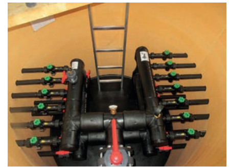
Ein seltener Blick in den Verteilerschacht.