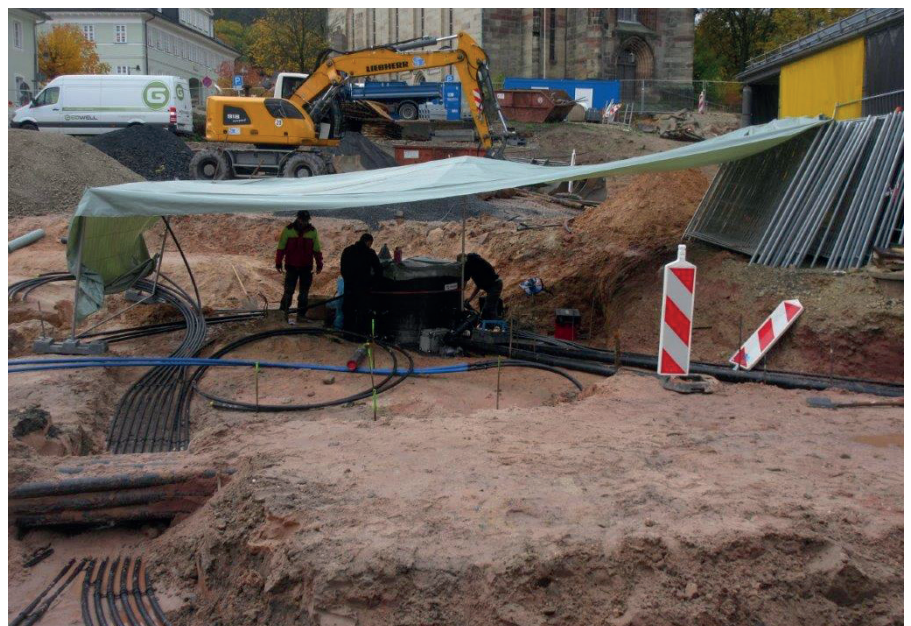
Die Arbeiten am Sammelschacht sind in vollem Gange.

Aber wie genau funktioniert eigentlich das Nutzen von Erdwärme? Bekannterweise ist der Mittelpunkt der Erde mit bis 6.000 °C sehr heiß. Bis zur Oberfläche kühlt der Planet stark aus. Wenn nun tief gebohrt wird, dann bemerkt man, dass die Erde die thermische Energie bis zu einem gewissen Grad speichert. Neu ist dies nicht, die Menschheit ist seit Jahrtausenden von warmen Heilquellen und Geysiren fasziniert. Aber eben diese Energie zu nutzen und unsere Gebäude damit verlässlich zu heizen und zu kühlen gelingt erst mithilfe moderner Technik. Für die entsprechenden Systeme in Neustadt ist ein Team der Geowell Erd-