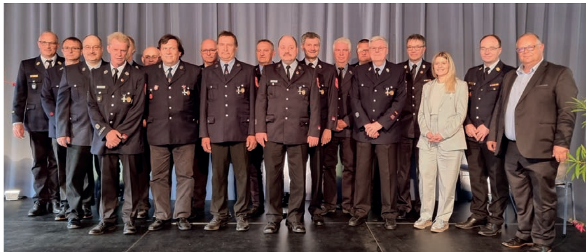
Geehrte Kameraden und Kameradinnen der Feuerwehr mit 2. Bürgermeister Martin Stingl in der kultur.werk.stadt

Die bauliche Neugestaltung des Marktplatzes ist abgeschlossen. Deshalb können alle Märkte ab dem 11.06.2022 endlich wieder auf dem Marktplatz stattfinden. Der erste Wochenmarkt auf dem neuen Marktplatz beginnt am 11. Juni 2022 um 08:00 Uhr. Darauf folgt dann der erste Monatsmarkt am 14. Juni 2022