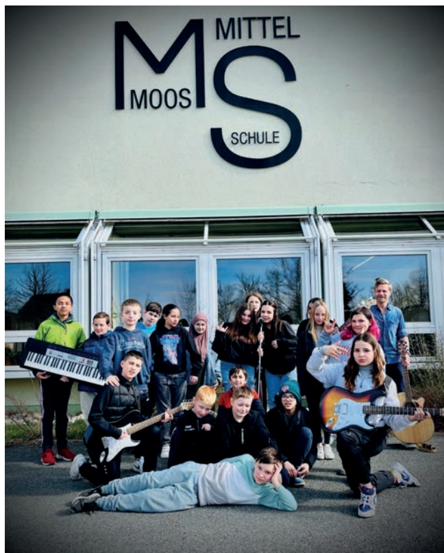
Die CLASS OF ROCK ist die aktuelle Bandklasse der Mittelschule am Moos

„Text: Bayerisches Staatsministerium für Unterricht und Kultus – Pressestelle“