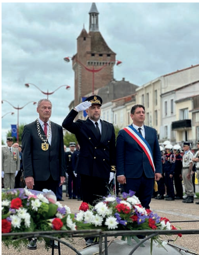
Oberbürgermeister Frank Rebhan, Unterpräfekt Arnaud Bourda und Bürgermeister Guillaume Lepers bei der Kranzniederlegung am Gefallenendenkmal in Villeneuve-sur-Lot.

© Presstext: Stadtverwaltung Neustadt bei Coburg