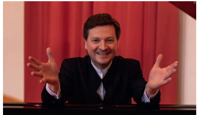
Pianist Christoph Soldan gastiert zum Neujahrskonzert in Sonneberg mit seinem Tourneeprogramm.

Pianisten durch eine gemeinsame Tournee mit Leonard Bernstein im Sommer 1989. Seitdem hat Soldan innerhalb zahlreicher Tourneen mit namhaften Orchestern in ganz Europa konzertiert. Aktuell stehen Klavierabende, Lesekonzerte, Konzerte für Kinder, verschiedene Tourneen mit insgesamt fünf Klavierkonzerten Mozarts, Brahms Klavierquintett opus 34, Schuberts „Forellenquintett“, Chopins e-moll Klavierkonzert, Ravels G-Dur Konzert in Bulgarien, Ungarn, Mazedonien, Deutschland, Italien, Spanien, Frankreich, Belgien und Österreich auf dem Spielplan.