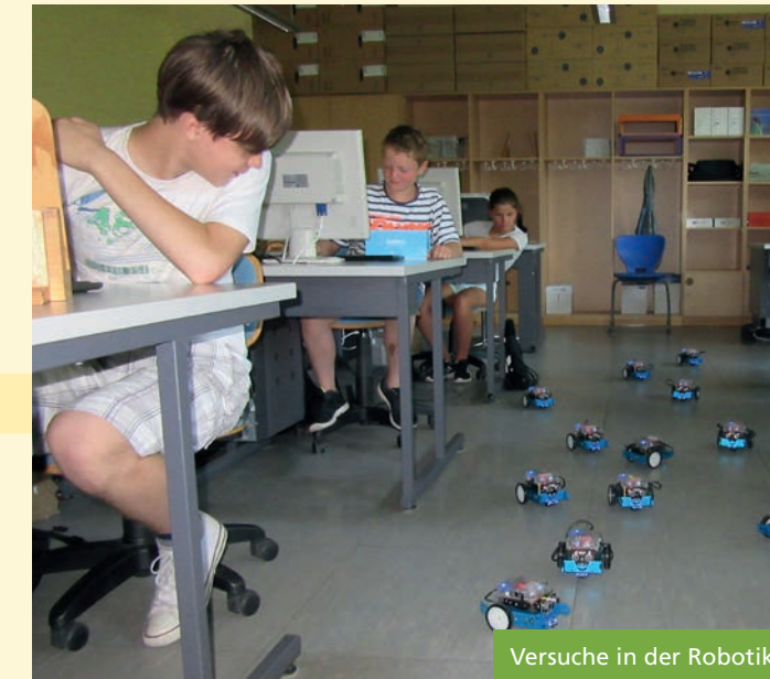
Versuche in der Robotik

MINT-Projekte (MINT = Mathematik – Informatik – Naturwissenschaft - Technik) fördern die Kinder im naturwissenschaftlichen Bereich.