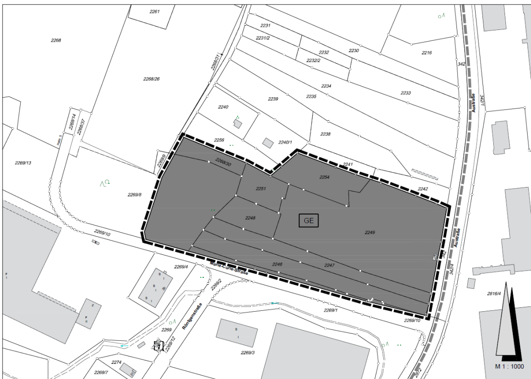
Nutzung der Geobasisdaten des Amtes für Digitalisierung, Breitband und Vermessung Coburg Digitale Flurkarte Stand 22.01.2020

Das Baugebiet umfasst insgesamt ca. 19.861,07 m 2 , davon sind 9.063,87 m 2 Gewerbefläche, 7.044,57 m 2 private Verkehrsfläche und 3.752,63 m 2 private Grünfläche.