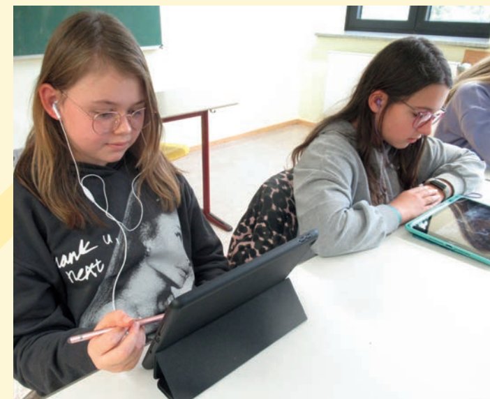
iPad-Klassen in vielen Jahrgangsstufen