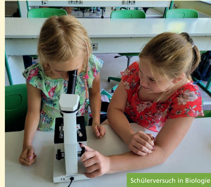
Schülerversuch in Biologie

In der 5. und 6. Jahrgangsstufe werden nur die all-gemeinbildenden Fächer unterrichtet. Danach ent-scheiden sich die Kinder zusammen mit ihren Eltern, welche der vier Wahlpflichtfächergruppen besucht werden soll. Von der 7. Klasse an werden dann etwa 70 % der Unterrichtsstunden weiterhin in den all-gemeinbildenden Fächern unterrichtet, dazu kommen die berufsnahen „Wahlpflichtfächer“.