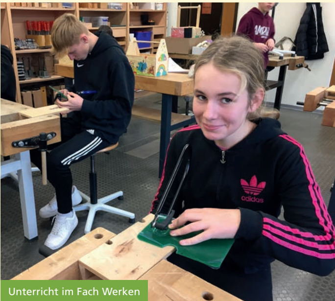
Unterricht im Fach Werken

An der Realschule Neustadt haben Sie die Wahl: