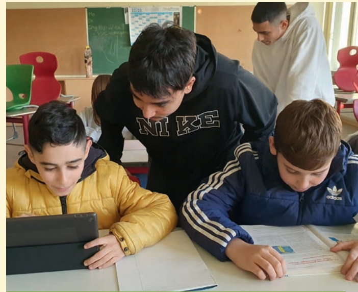
Hausaufgaben mit Tutoren in der offenen Ganztagesbetreuung

In der offenen Ganztagsbetreuung werden nicht nur Hausaufgaben gemacht. Die Kinder verbringen auch ihre Freizeit sinnvoll und können an einem breit gefächerten Programm teilnehmen. Ein Team aus Sozialpädagogen, Mentoren und Lehrkräften sorgt nach Unterrichtschluss und dem Mittagessen in der Mensa bis 16 Uhr dafür, dass jedes Kind bestmöglich gefördert wird.