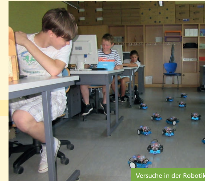
Versuche in der Robotik

MINT-Projekte (MINT = Mathematik – Informatik – Naturwissenschaft - Technik) fördern die Kinder im naturwissenschaftlichen Bereich.