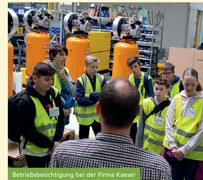
Betriebsbesichtigung bei der Firma Kaeser

Der Weg in die berufliche und schulische Zukunft nach der 10. Klasse wird geebnet durch: